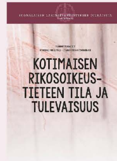
Kimmo Nuotio – Esko Yli-Hemminki (toim.) Kotimaisen rikosoikeustieteen tila ja tulevaisuus (E 29) 50 € / jäsenhinta 35 €